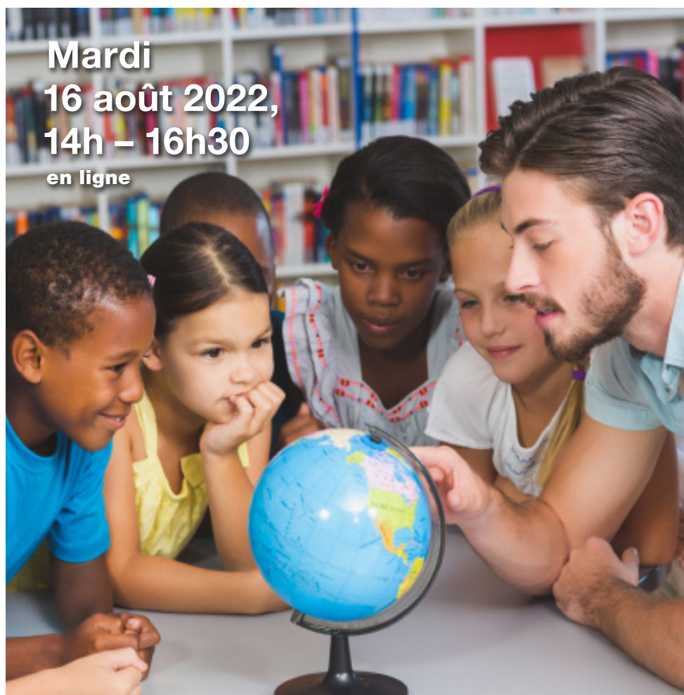
Table ronde « Santé, école, Ukraine »