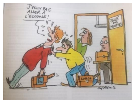
Illustration de Yves Giroud reprise du dossier de l'Éducateur 7 / 2019

Accompagner les enseignant·es dans la complexité du travail, dossier réalisé par Yann Volpé, Educateur 7/2019, pp. 3-18